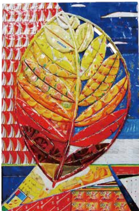
(左から)「葉」2006年、「cosmos」2012年、「春の目覚め」2014年