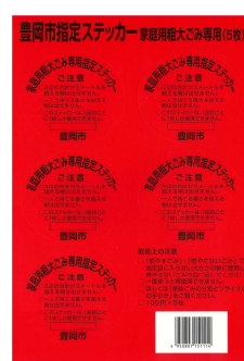
燃やすごみ袋（赤） 燃やさないごみ袋（黒） 資源ごみ袋（緑） ステッカー