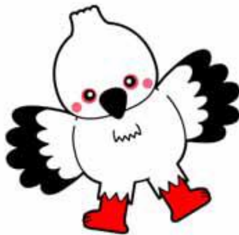
豊岡市マスコット コーちゃん