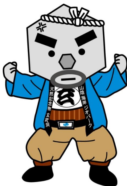
豊岡市マスコット 玄さん