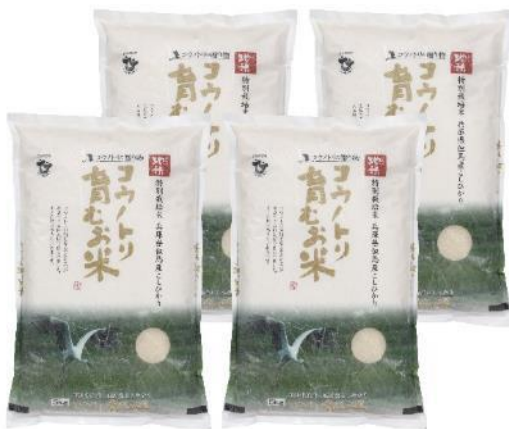
コウノトリ育むお米