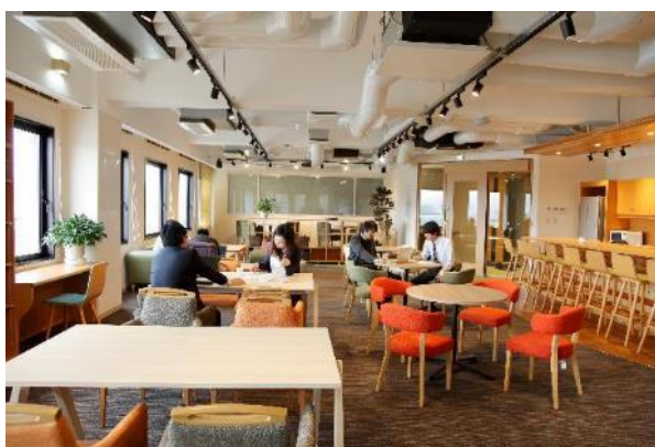
異業種交流の場として活用できる コワーキングスペース「FLAP TOYOOKA」