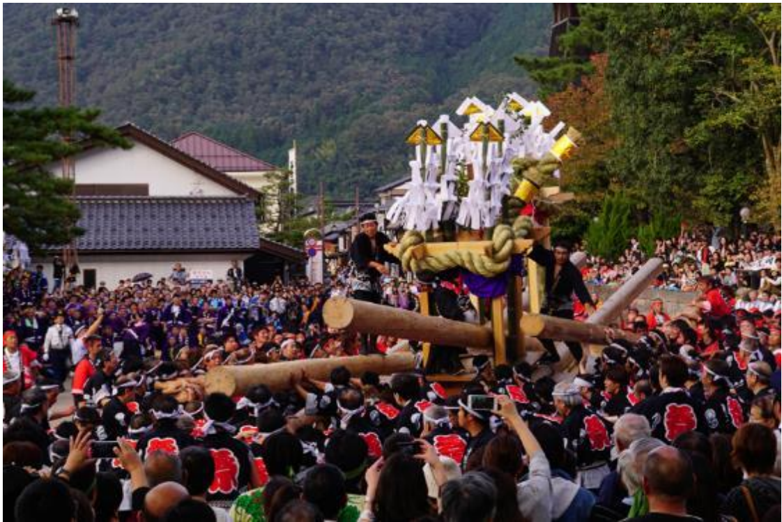
長さ 17m の棒がぶつかりあう喧嘩だんじり（出石）