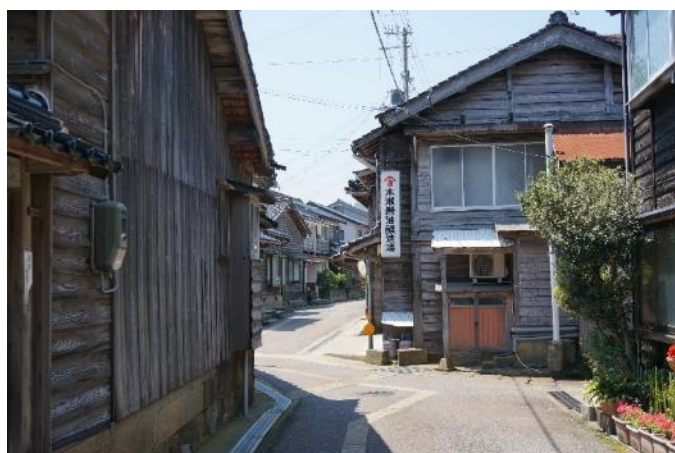
焼き杉板の町並み(竹野)