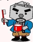
豊岡市マスコット「玄さん」