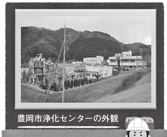
豊岡市浄化センターの外観