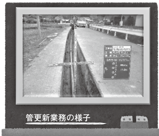
管更新業務の様子

安全・安心な飲料水の安定供給を図るため、古くなった水道管の布設替えを、耐震管を使い計画的に更新しています。