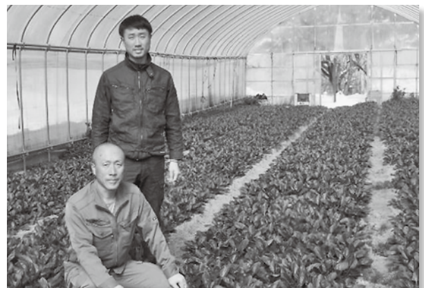
収穫を待つほうれん草と

若い農業者が、大規模でもなく農業未経験でも一生懸命農業に取り組まれる姿に頭が下がる思いです。是非、若い力でイノベーションを起こして下さい。期待しています。(上坂光広委員)