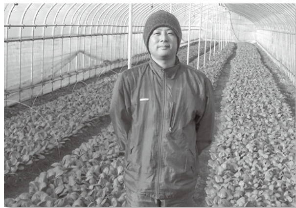
雪害対策が講じられたハウス内で