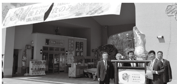
西日本最大級の道の駅 丹後王国「食のみやこ」(京丹後市)

品の販売状況 には目を見張 るものがあつ た。そこから 北には道路直 結の道の駅が ないことから、 豊岡市として 道の駅の構想 を早期に立ち 上げる必要性 を感じた視察 であった。