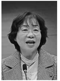
上田 伴子議員 (日本共産党・あおぞら豊岡市議員団)