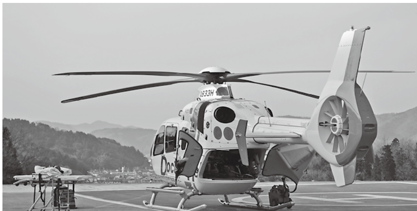
命を救う「ドクターヘリ」

問 27年度 のドクター ヘリの出動 回数は17 61回、ド クターカー は1700 回である。 ドクター カーの24時 間運用を5 月から開始 するが、継 続のために は救急医師 の継続的な 確保とドク ターヘリ、 ドクターカ ーに従事す るナースの 育成が課題であると聞い ている。