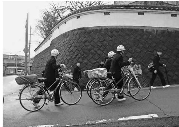
入学準備金の入学前支給を