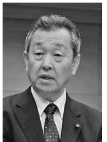
松井 正志議員 (とよおか市民クラブ)