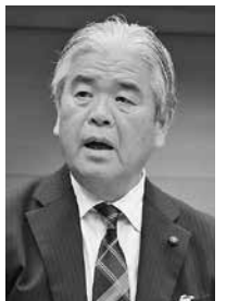
井上 正治議員 (とよおか市民クラブ)