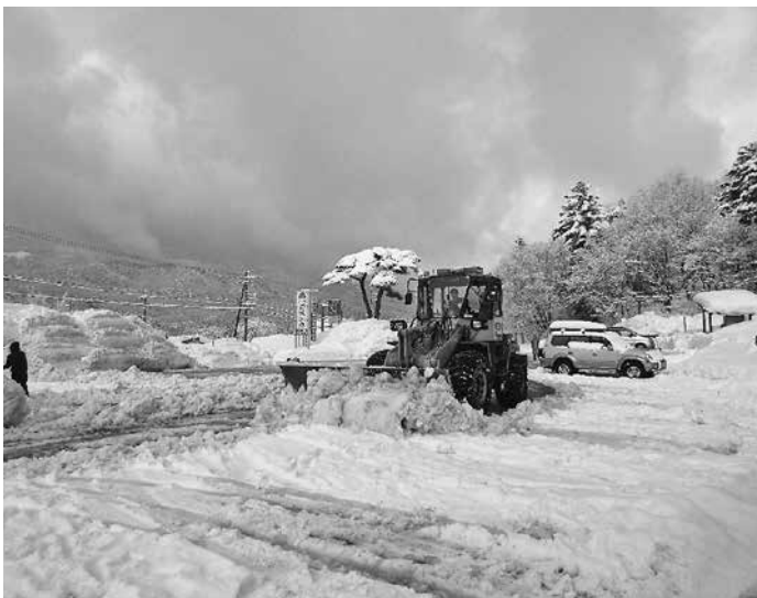
今シーズンの「道の駅神鍋高原」駐車場

問 雪は豊岡の宿命であり、全体としてははおおむね冷静な対応を行政側も市民の皆さんもできた。今後、雪への対応能力を高め、雪への対応能力を高める必要がある。区が除雪