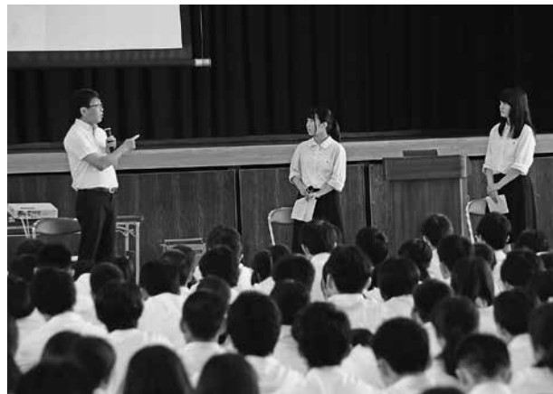
高校生との意見交換会