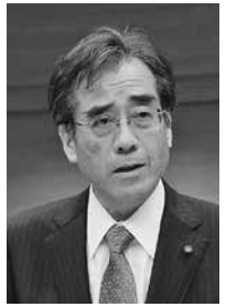
井垣 文博議員 (とよおか市民クラブ)