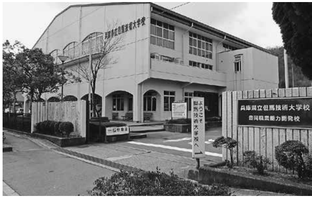
若者回帰がより期待される但馬技術大学校