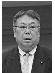
木谷 敏勝議員 (かがやき)