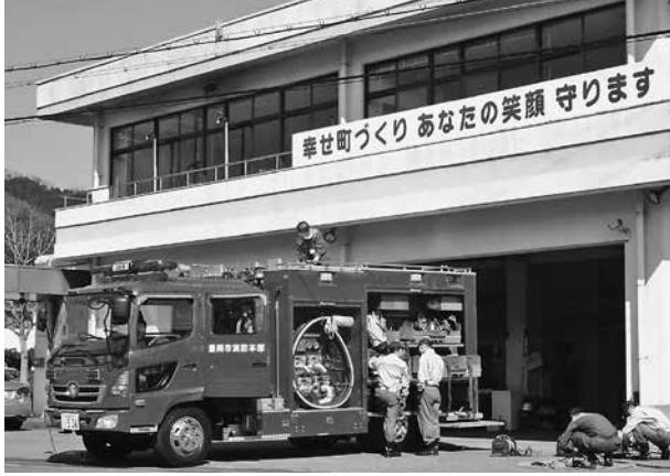
災害に備える消防署員と初期消火で活躍する水槽付消防ポンプ自動車

防の徹底だ。強風下での消火活動では、市民による初期消火体制を確立し、火災を拡大させない。木造密集街区の消防活動計画の策定と訓練を行い、本市6消防