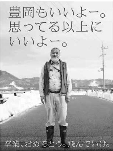
いいものいっぱい持って帰ってこいよ〜

答 29年度から全ての公立小・中学校で一貫教育を実施。ふるさと教育・英語教育・コミュニケーション教育を柱にしてローカル&グローバル学習を行っていく。小さな世界都市を目指す、豊岡の未来を創造する子どもを育成していく。