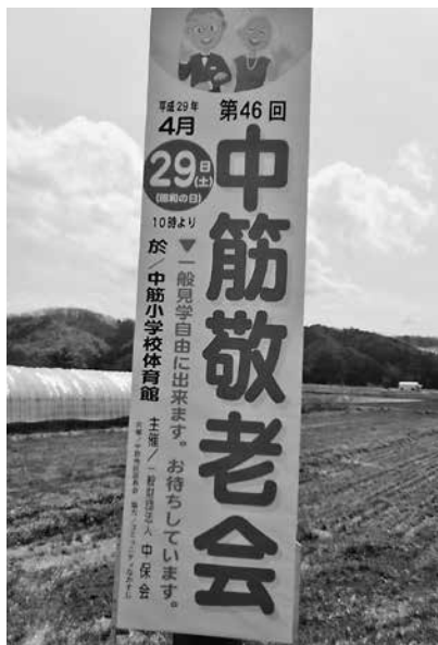
46回の伝統 来年以降も引き継ぎたい！

問 全国の地方といわれ る自治体はどこも「地方 創生」の叫び声で施策の 展開と予算化をしてい る。29年度予算の打ち出 しを「地方創生・未来へ の挑戦」として未来志向 の予算としている。未来 を考えない予算はよくな いことは当然だが、未来 への挑戦は、今よりも未 来のために、今求められ る施策が後回しや選択肢 から外されることになり はしないか。今の暮らし が大変だという市民の願 いに応えた予算となつて いるか