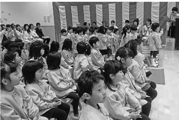
入園式。この子たちのためにやることは…。