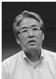
竹中 理 議員 (公明党豊岡市議員)