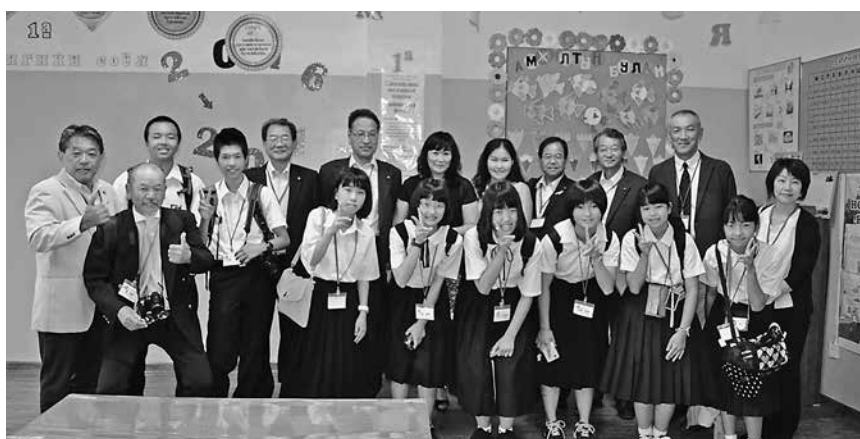
行ってみようモンゴルへ！さらなる交流を！

答 但東町に始まり、国際化時代に対応できる人材育成を目的に、市内全域の中学生を対象にした交流を相互に進めてきた。これまでモ