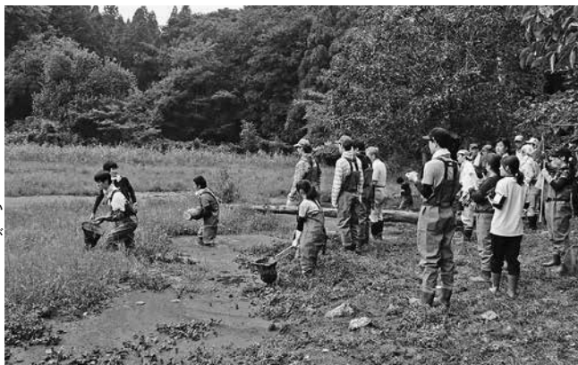
湿地保全のため多くのボランティアが参加

問 日高町の通称伊府 いふ 湿地で、ボランティアによる湿地保全活動や環境保護、コウノトリの生息場所づくりが行われている。市としてどのように認識し評価しているか