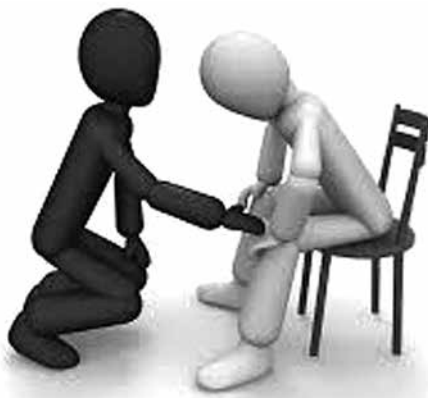
何にも増して尊い寄り添い

を最大限活用し少しでも多くの市民に優しい観点を織り込む取組みを取り入れるべきだが