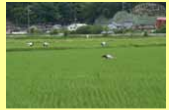
農家の人の横でエサを採るコウノトリ

コウノトリがいる当たり前の風景を維持し、広げて いきます コウノトリの餌場となる湿地を創造し、維持します ビオトープ水田や魚道を整備し、たくさんの生き ものが暮らす水田を維持します