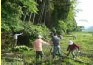
都会の人達と一緒に里山に 茂る竹林を伐採