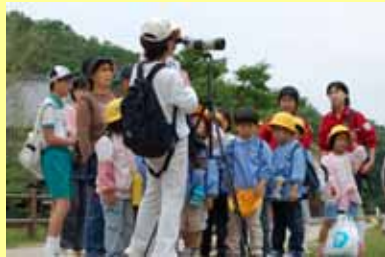
豊岡を知る「コウノトリツーリズム」で交流

環境と経済が共鳴し合う事業やビジネスの創出 を支援します 生きものを育む農業である『コウノトリ育む農法』を 広げていきます 自然環境と文化環境を題材としたコウノトリツー リズムを推進し、交流の輪を広げます