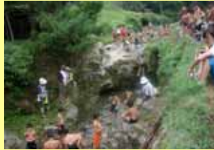
子ども野生復帰大作戦

生きもの調査等により、自然や生きものへのまな ざしを醸成します 未来を担う子ども達の自然体験の機会を増やし ます 里山を整備し、人と自然が共生する森づくりを進 めます