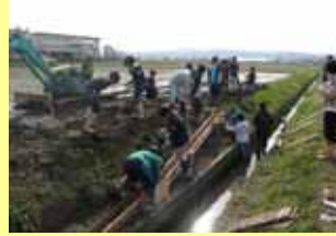
生きものを増やすため魚道をつくる子ども達