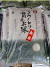
生きものを増やす農業 「コウノトリ育む農業」