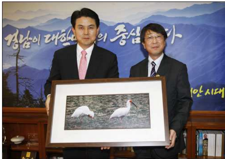
▲ 일본 호고현 토요오카시 나카가이 무네하루 시장이 30일 경남도청을 방문하고 김태호 지사와 이야기를 나누었다.