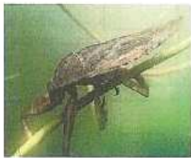
卵がかえるまで3週間近く食事をせず、 せわを続けるオスのタガメ。