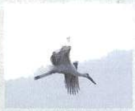
絶滅したコウノトリの復活が目標されている。 田んぼは餌場として欠かすことができない。