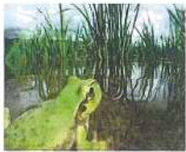
寒さに耐え、稲とともに成長する初春の アマガエル。