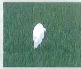
ミジンコをドジョウが食べ、ドジョウをサギが 食べる。脈々と続いていく命の連鎖。