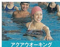
アクアウオーキング 水の中を歩行して無理なく全身運動。