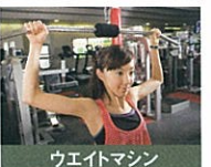
ウエイトマシン 気になる部分を効果的にひきめ。