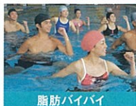
脂肪バイバイ 水の抵抗を利用して脂肪燃焼します。