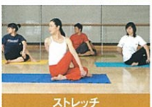
ストレッチ 格闘技の動きで全身をシェイプ。