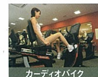
カーディオバイク 有酸素運動で脂肪を燃焼。