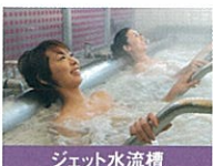
ジェット水流槽 水流の力で全身マッサージ。