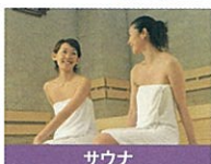
サウナ 汗をかいて気分をリフレッシュさせます。