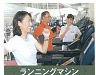
ランニングマシン 自分のペースでランニング。