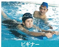
ビキナー 初めての方は顔付けから。