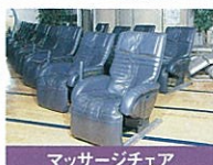
マッサージチェア 運動で疲れた身体をほくします。