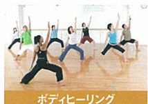
ボディヒーリング ゆったりとした動きで初めての方にも安心。色々なポーズで柔軟性を高めます。