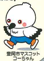
豊岡市マスコット コーちゃん