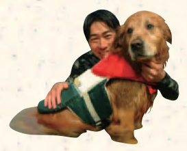
青井浜ワンワンビーチ