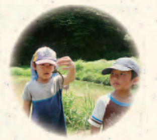
どろんこちるとれん