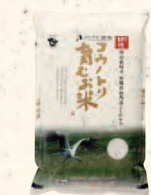
コウノトリ育むお米