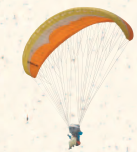
神鍋パラグライダー