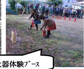
消火器体験ブース