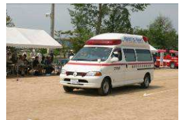
救急車・指揮車・救助工作車展示