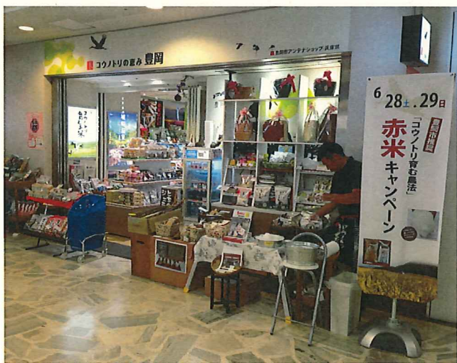
赤米キャンペーン