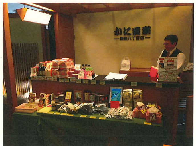
かに道楽店舗での販売