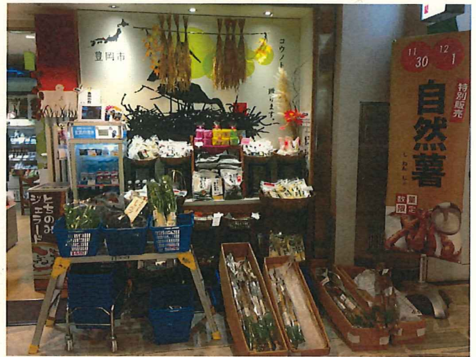
自然薯の特別販売