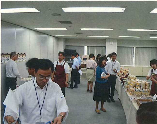
三井住友生命保険本社への出張販売