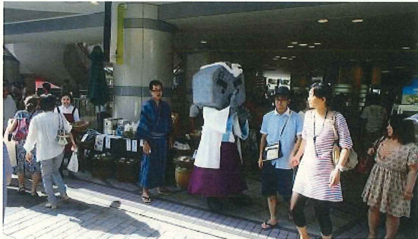
東京交通会館「有楽祭」でマルシェ出店