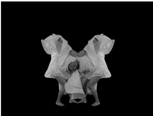
'The Visitor' リザ・マナロ作、パフォーマー:ゆみ・うみうまれ(2013年ビデオ作品)