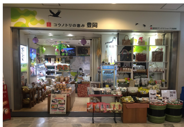
アンテナショップ店舗