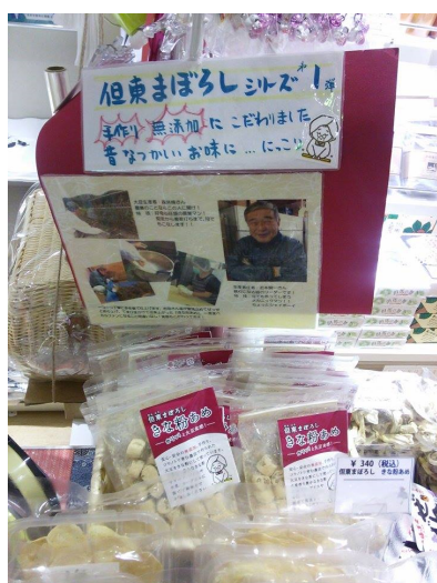
チャレンジ商品「きなこあめ」