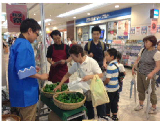
ピーマンつかみ取り