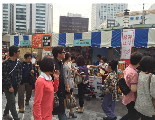
有楽町地域交流物産展