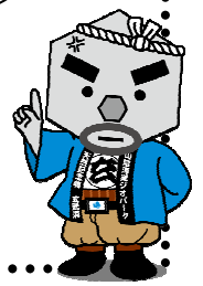
豊岡市マスコット 玄さん