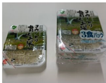
【減農薬 200g】 ※無菌包装米飯