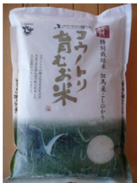
【無農薬 精米 2kg】