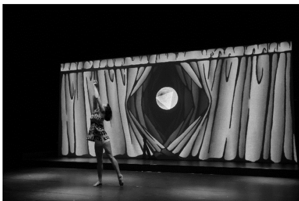
『錆からでた実』(2013) ©Yoichi Tsukada