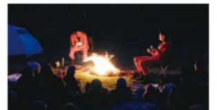
『MONTAGNE』(フランス南アルプス・Gap 国立舞台、2016年)