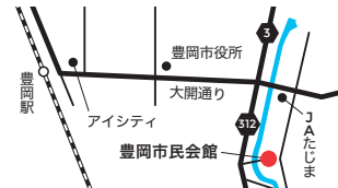
JR豊岡駅・KTR豊岡駅からタクシー5分 全但バス 豊田町バス停から徒歩1分

対象：小学生 定員：15名 日時：2017.3.18(土) 13:00~17:00 会場：豊岡市市民会館 (兵庫県豊岡市立野町20-34) 参加費：無料 ※要事前申込 主催：城崎国際アートセンター