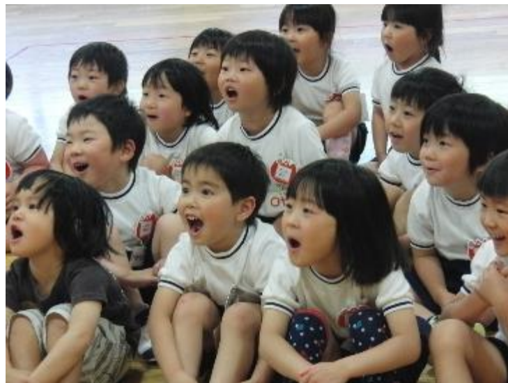
“Hello!!” 元気よく、あいさつをする園児たち（竹野認定こども園）

そして、英語遊び指導員や保育者、子どもたち同士の関わりの中から「英語大好き」という気持ちを持った豊岡の子どもたちが、小学校へ確実に受け継がれ、これらの気持ちや力を引き続き大きく膨らませながら、夢実現力をさらに育み続けてくれることを心から願っています。