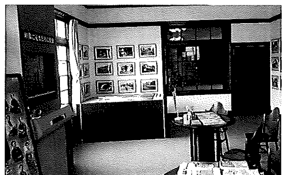
(出石鳥瞰マップの展示や出石の歴史紹介DVDを映す設備のある休憩サロン)