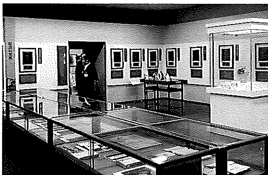
(歴史を彩った出石の人物展)