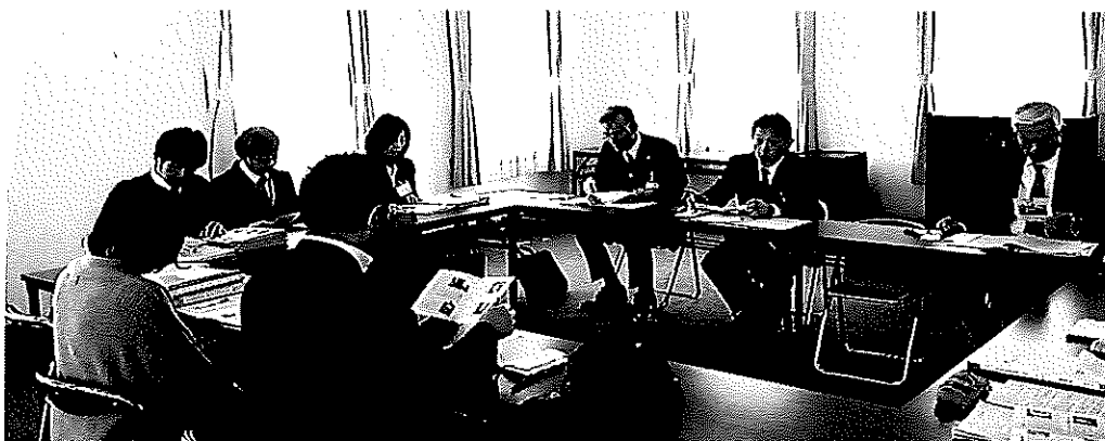
(出石ライオンズクラブによる説明)