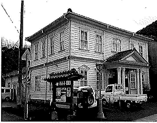
(豊岡市指定文化財 出石明治館)