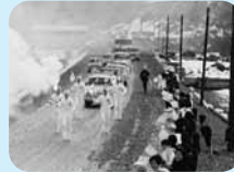
住民が見守るなか行われた炬火リレー(昭和40年2月)

日高町で冬季国体が開催されたことをご存じですか? 第12回(昭和32年)と第20回(昭和40年)に、神鍋高原で国体冬季大会スキー競技会が開催されました。