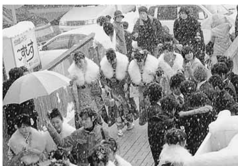
大雪で足元が悪い中、会場入りする新成人

市町合併後初の成人式は2部形式で行われました。第1部の式典・アトラクションは、市が主催し、新成人が司会進行などを担当。第2部は交流パーティーで、新成人13人が実行委員会をつくり、自分たちの手で企画運営などのすべてを行いました。当日の様子は次のとおり紹介します。