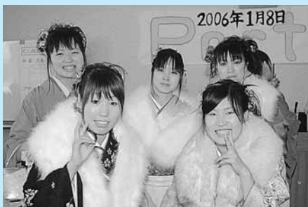
素敵な思い出(出石・但東)