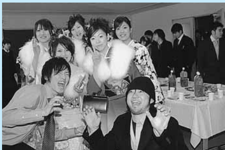
楽しいパーティー(城崎・竹野・日高)