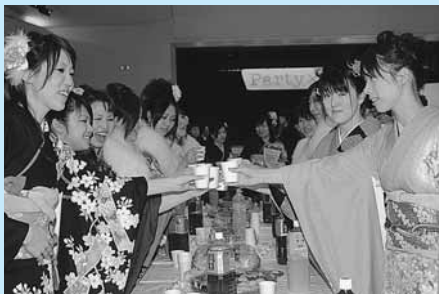
成人を祝って乾杯(豊岡)