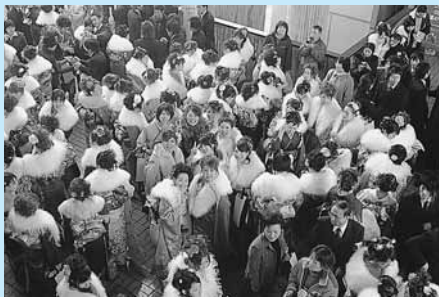
式典会場から交流パーティー会場への大移動