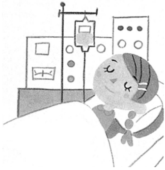
自己負担限度額(1カ月当たり)

2年を過ぎると支給されませんので、忘れずに申請してください。また、70歳未満の方と70歳以上の方では限度額が異なります。