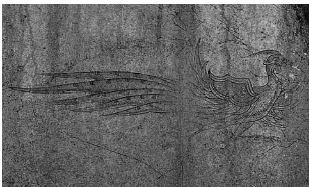
キトラ古墳壁画 朱雀

期間 ~ 1月24日(火)まで 開催中 内容 キトラ古墳などで今話題の飛鳥。謎の石像物「猿石」やキトラ古墳壁画の実物大写真など多くの資料から、飛鳥時代の都と豊岡の姿を体感していただけます。 入館料 一般500円、高校生・大学生200円 小中学生150円(小中学生はココロンカード提示で無料)