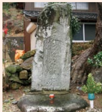
▶ 金剛界五仏種子板碑

滝の岩肌に不動明王像が彫られています。古くは修験場として栄え、身を清めに訪れる人々が絶えなかったといわれています。