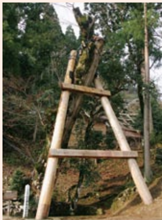
◀ 小江神社の大ケヤキ

小江神社の境内には、樹齢約300年の大ケヤキがあります(昭和43年3月に県重要文化財に指定)。ケヤキ近くには、「江野の岩清水」と呼ばれる湧き水があり、地元の住民はおいしい水として利用しています。