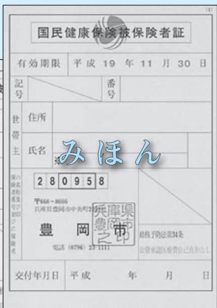
▲国民健康保険被保険者証(黄緑色)