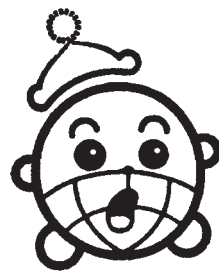
「コックン」 国保キャラクター

合は、保険証・印鑑・その他の必要な書類を持参し届けてください。 ▽問合せ 市民課国保医療係 または各総合支所市民生活課