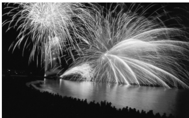
▲海上から打ち上げられる花火は浜辺のどこから見ても迫力満点

2つの船から、水面に向かって打ち上げられる約1,700発の花火は海面に映え、他に例のない美しさです。「海と宮殿」をテーマにして繰り広げる今年の花火大会では、「コウノトリ紀行」と題したオリジナル花火も打ち上げます。心に響く音と光の祭典で感動を味わってください。