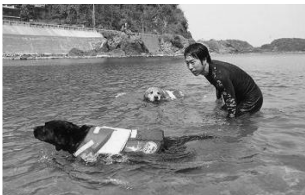
▲ワンワンビーチはルールを守って利用ください