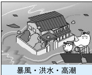
暴風・洪水・高潮