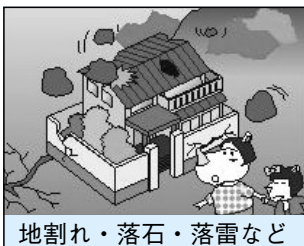
地割れ・落石・落雷など