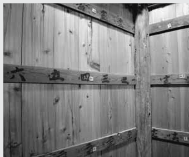
「鳥屋」の内側に残る下足場のなごり

「下足場」とは昔、履物を脱いで棧敷に上がるときに「下足番」と呼ばれるスタッフが番号札を渡して履物を保管する場所です。戦後、客席が棧敷席から椅子席に替わり、土足のまま客席に入れるように改修されました。そのため「下足場」が不要になり、新しく設けられた「鳥屋」に「下足場」の部材が使われ、下足番号のなごりが残りました。