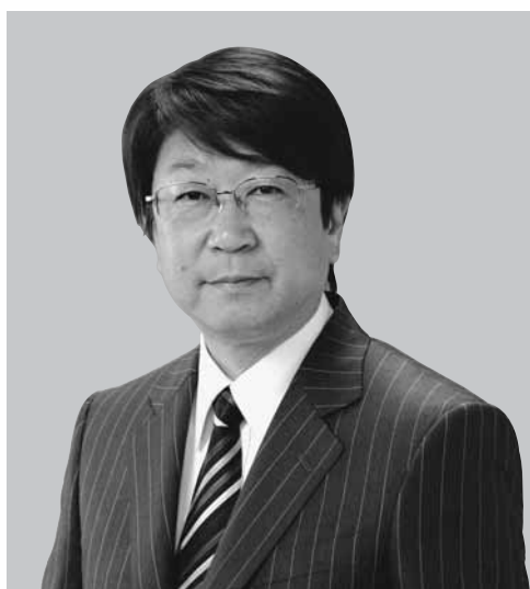
豊岡市長 中貝宗治