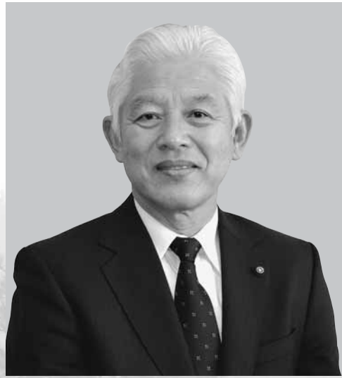
豊岡市議会議長 川口 匡