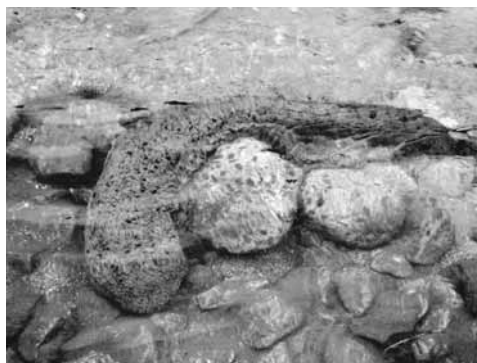
オオサンショウウオ

平成16年の台風23号により氾濫した出石川で413頭が保護され、復旧後の平成19年11月、うち70頭が試験放流されました。未曾有の大災害から復旧・復興し、安全で安心して暮らせるまちづくりを目指す豊岡市のシンボルとして、「オオサンショウウオ」を「市の両生類」に制定します。