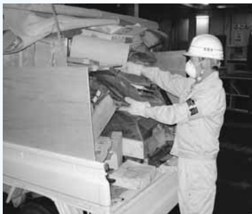
搬入されたごみを検査する検査員

このほかにも、6分別等の受け入れ基準の徹底を図るため、持ち込まれたごみの検査を実施しています。