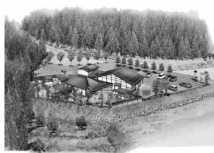
「たんたん温泉 福寿の湯」のイメージ図

但東町の資母地区において地域の活性化を図るため、平成20年8月のオープンを目指し、整備を進めている(仮称)但東北部温泉施設について、地元の資母地区振興対策協議会が6月25日から8月31日にかけて名称募集を行いました。9月21日、寄せられた107点(89人)を同協議会で協議、選考し、10月16日、市において名称案を「たんたん温泉福寿の湯」に決定しました。温泉名は、予定地に隣接する国道482号の「たんたんトンネル」と地元の名水「福