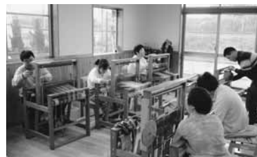
さをり織りの作業をする「とよおか作業所 愛・とーぷ」の皆さん

障害者自立支援法が施行されて1年半が経過しました。市内には、下表のとおり授産施設や小規模作業所など障害者が生き生きと活動されている拠点がたくさんあります。施設を見学してみたい方や利用してみたい方などは、気軽に施設へ問い合わせください。