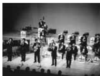
アロージャズオーケ ストラ