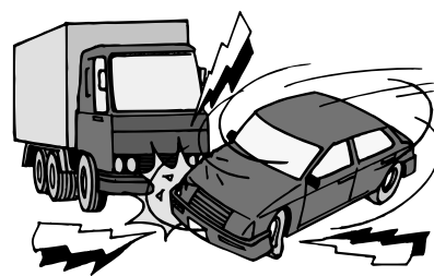
市内の交通死亡事故発生状況(平成19年1月～8月)

交通事故は、決して「他人事」ではありません。一瞬の油断で起こる交通事故が、自分だけでなく周囲の方の人生も狂わせてしまいます。あなたが「絶対に事故に遭わない」という保証はどこにもありません。市民の皆さん一人ひとりが交通事故を自分のこととして考えましょう。