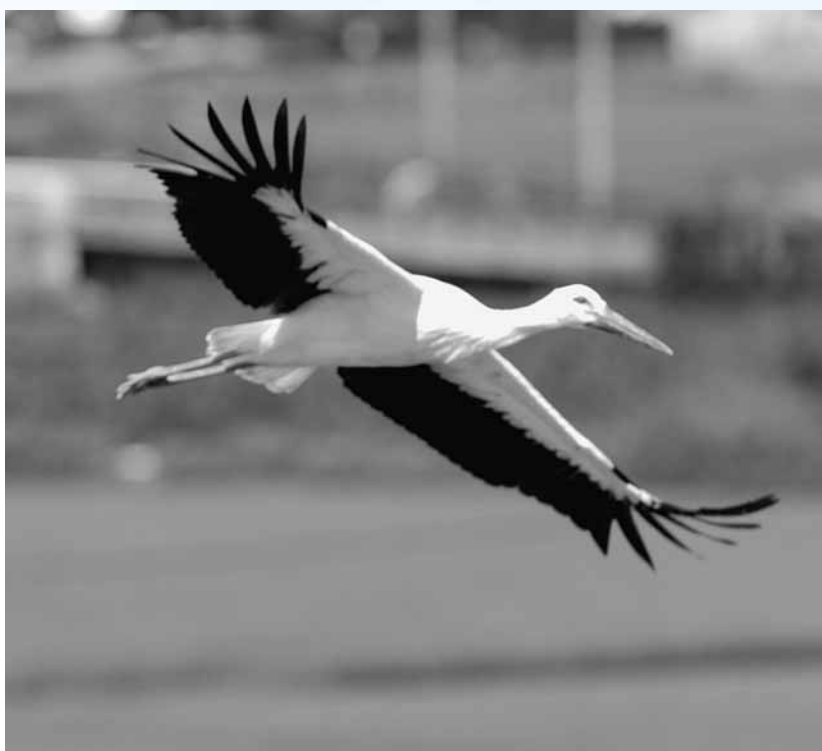
人工巣塔から巣立つ放鳥コウノトリのヒナ = 7月31日午後2時16分、豊岡市百合地