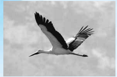
市内の上空を舞うコウノトリ