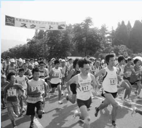
昨年の大会の様子