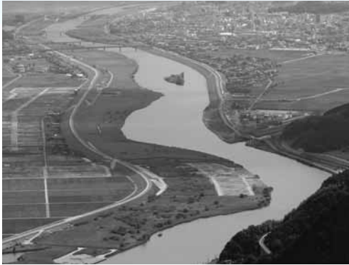
来日岳から望む豊岡盆地

市では、市の基本構想で定めた目指すべきまちの将来像「コウノトリ悠然と舞う ふるさと」の実現に向けて、市民が親しみをもって永く愛唱できる「豊岡市歌」を制定します。市民の皆さんにわがまちへの誇りや愛着、一体感を感じていただき、豊かな自然と歴史や文化に恵まれた豊岡市のイメージを市内外にアピールし、市のイメージを描けるシンボルとするものです。