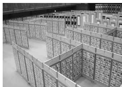
第6回展では全国24都道府県から4,143点の応募がありました

今回から「高校生の部」を新設しました(表彰・審査は一般と別枠で行います)。皆さん、ぜひ、応募ください。