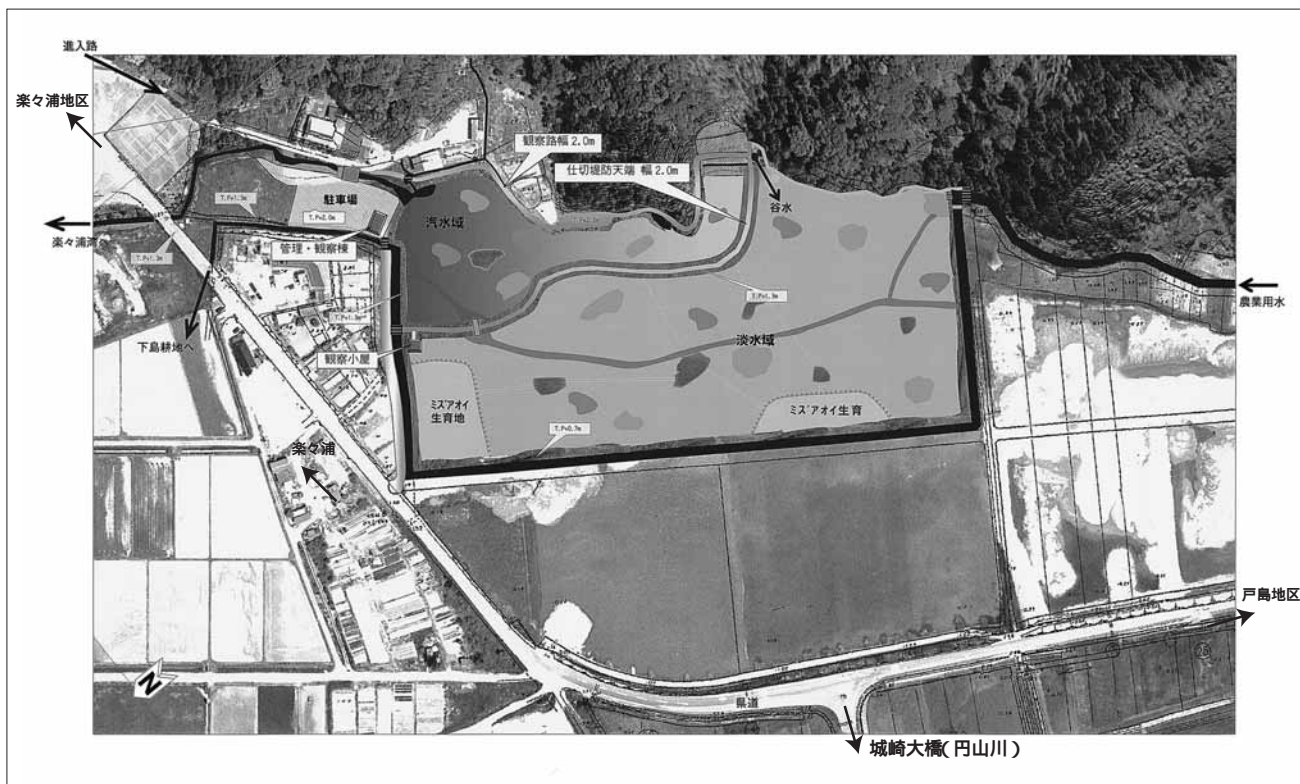
湿地整備イメージ図

市では、城崎町戸島地区の元水田などをコウノトリが舞い降りることのできる湿地として整備する『(仮称)「ハチゴロウの戸島湿地」整備基本構想・計画』を策定しました。