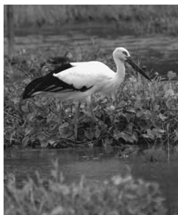
(仮称)ハチゴロウの戸島湿地のハチゴロウとミズアオイ (平成17年9月撮影)