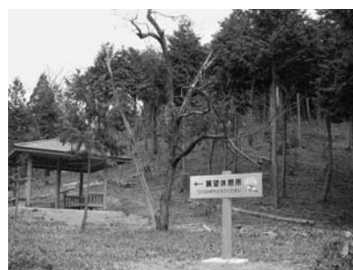
入口から約450メートル付近。竹野川を見下ろすことができる

総面積は10・7ヘクタール、遊歩道は1、114メートルあり、休憩施設の東屋2棟を整備しています。